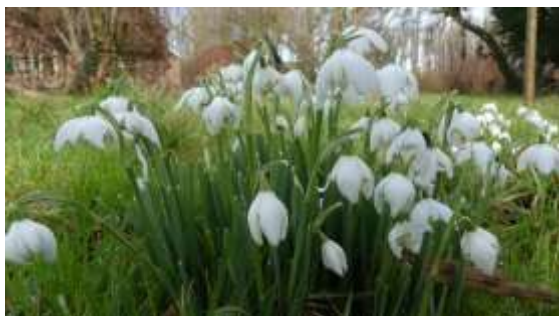
Dubbel sneeuwklkje ( Galanthus nivalis 'Plenus')