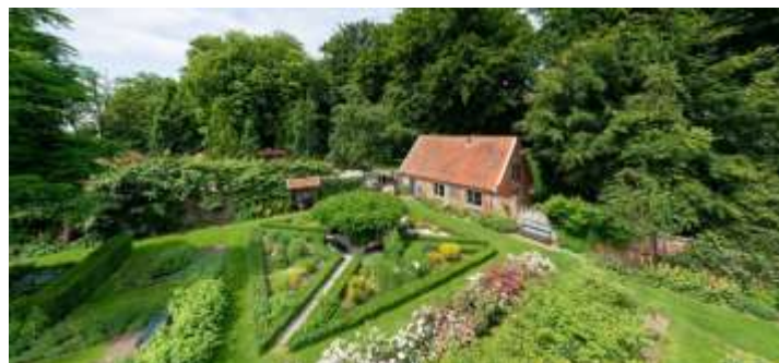
Siertuin Gooilust

Tijdens deze middagexcursie brengen we een bezoek aan de siertuin op buitenplaats Gooilust te 's-Graveland (NH).