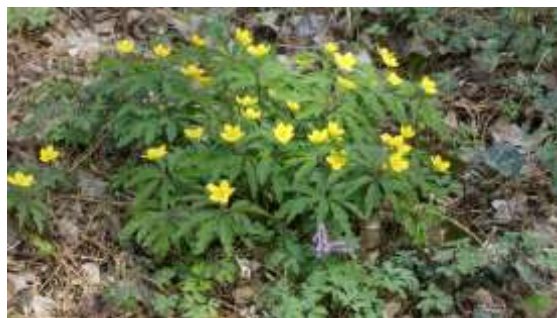
Gele anemoon, Thijssepark Amstelveen

Vorig jaar zijn we met een aantal leden eind februari, eind maart en eind april naar het Thijssepark geweest. Nog eens de foto's bekeken en dan is er in februari en maart nog niet zo heel veel te zien aan voorjaarsplanten. We hebben daarom besloten de excursie uit te stellen naar woensdag 13 april.