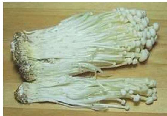
Foto witte zwammen is van wikipedia https://nl.wikipedia.org/wiki/Fluweelpootje

was. Ze schijnen erg gezond te zijn en een afweer- en weerstand verhogend effect te hebben.