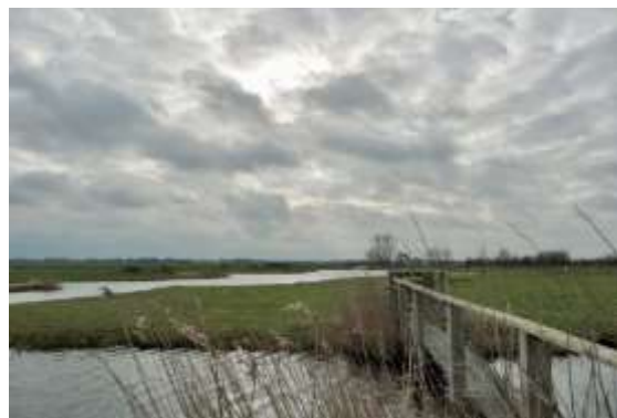
Bruggetje polder Demmerik

Op 9 februari met Ad naar de Demmerikse polder, via de plek waar de koereigers zaten. Helaas, ze waren er niet meer.