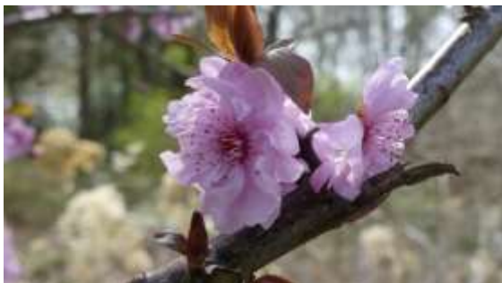
Siertuin Gooilust: bloemen Prunus blireiana

Vertrek uit Woerden om 13.00 uur vanaf P-Houttuinlaan Woerden, 13.45 uur bij Gooilust, Zuidereinde 47B, 1243KL 's-Graveland (volg de borden siertuin). Parkeren aan de linkerzijde van de oprijlaan. Aanmelden bij Ank: n.h.secretaris@woerden.knnv.nl