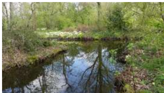
Thijssepark Amstelveen