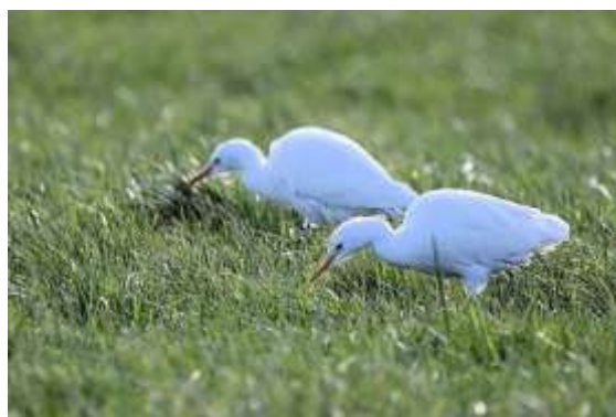
Koereigers polder Vinkeveen-Wilnis

Ik heb 'onze' KNNV-vogelfotograaf, Dammis, ingelicht. En Dammis stuurde enkele dagen later onderstaande foto van de koereigers.