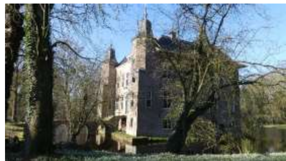
Huis te Linschoten, februari 2021

Zaterdag a.s. gaan we naar Landgoed Linschoten. De sneeuwklkjes bloeien evenals de winterakonieten. Wellicht ook de eerste daslook.