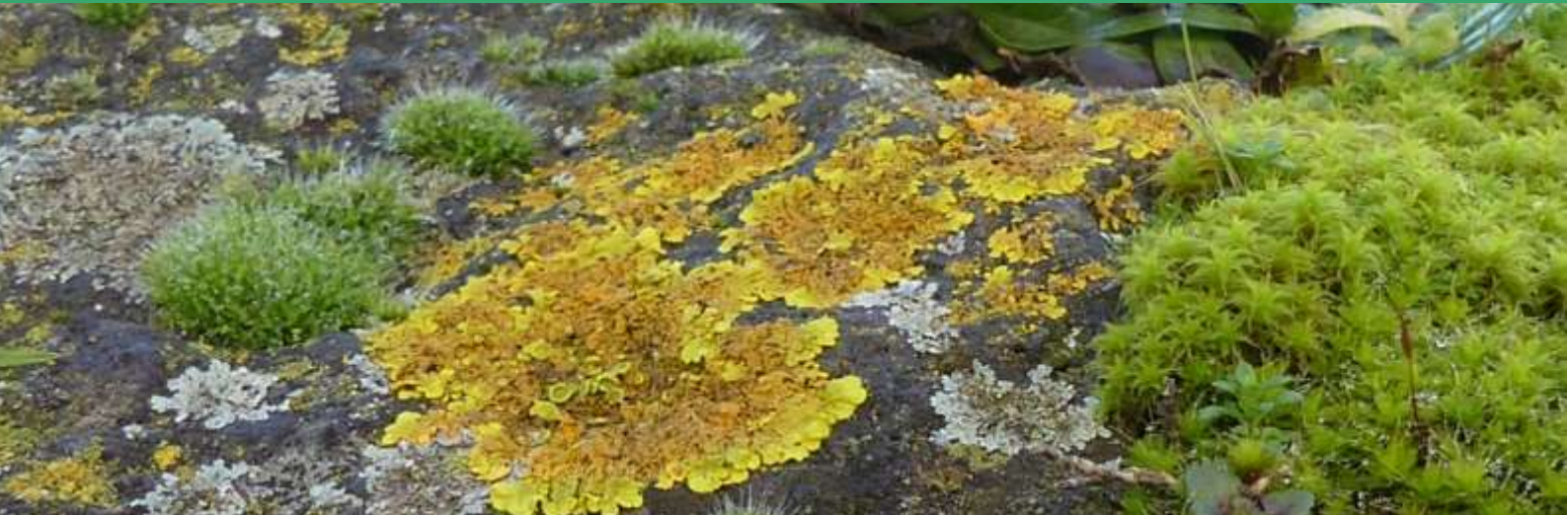
Mossen en korstmossen op een speelplaats in Woerden.