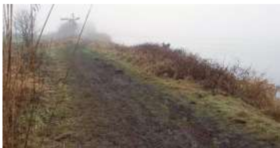
Mistige ochtend in Williskop

Mariëtte en ik zagen tijdens onze wandeling over de Grechtdijk bij Kamerik (8 januari) een vrouwtjes grote zaagbek.