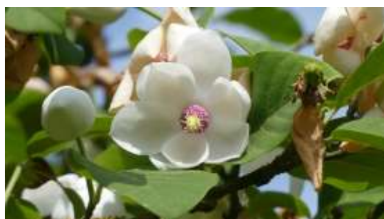
Een van de vele Magnolia's in het Gimbornpark